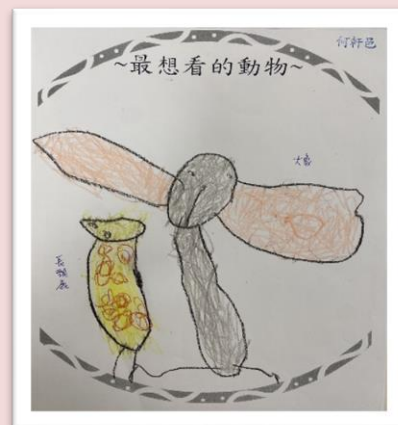
☆裝飾-動物明星窗簾